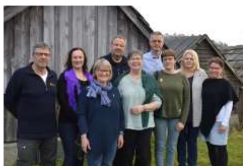
Landsstyret i Forbundet KYSTEN