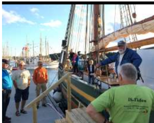
Skreien lagt til kai etter seilas fra Nærnesbukta