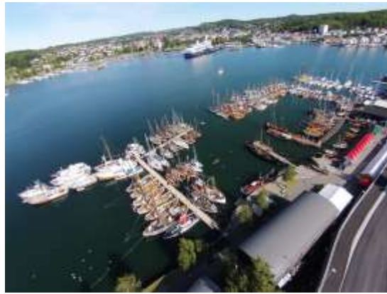
Oversiktsbilde fra havna