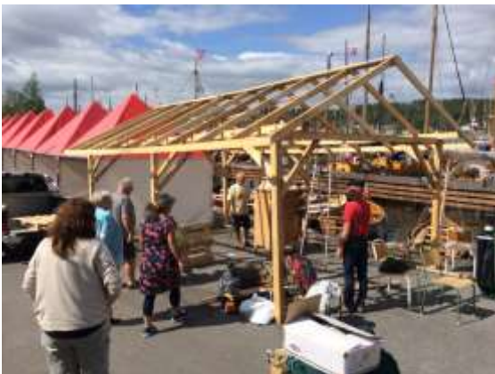
Naust og "Istiden" rigges ned

Det var en svært entusiastisk gjeng fra kystlaget som var i sving og vi vil benytte anledningen til og takke de som hadde anledning til og være med på dette. Samtidig må nevnes et fantastisk arrangert landsstevne v/Gokstad kystlag og vi sender en stor takk til dem.